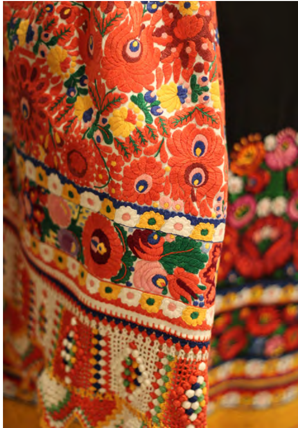
Gazdagon hímzett lobogósujjú ing részlete

Kérem, fogadják szeretettel, és a skanzen csapatának azt kívánom, hogy ahogyan a korábbi helyszíneken is, legyen itt is a látogatók kedvence és a múzeum közönségcsalogató programja a matyó népművészet!