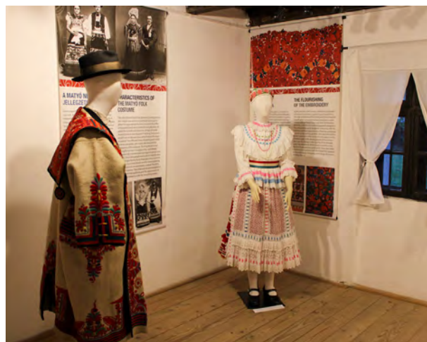
Részlet a kiállitásból: tardi férfi és szentistváni fiatalasszony ünnepi viseletben

A szabadrajzú hímzés felhasználásával ki-színesedő matyó ünnepi ruházat a magyar viseleti kultúra egyik leglátványosabb részét képezi. A hímzés és a viselet erősen meghatározza a helyi identitást is, aminek a szellemi műveltségben, a folklórban is megnyilvánuló elemeit jól ismerjük. A legfőbb hímzésmotívum, a matyó rózsza eredetmondája szerint a matyó legényt fogva tartó török (más változatokban az ördög) télvíz idején kényszeríti a leányt, hogy reggelre egy teli kötény rózsát hozzon, ha ki akarja szabadítani a kedvesét. A leány az éjszaka telehímezi a kötényt rózsákkal, a szabadítás sikerül, ez a magyarázata a teljes felületet kitöltő színes virágos hímzésnek. Hasonlóan közismert a Hadd korogjon, csak ragyogjon! szólás, amely érzékletesen megvilágítja a drága viselet előállításának hátterében húzódó megélhetési nehézségeket, olykor a szó szerinti éhezést, a hagyomány szabályozó erejének árnyékosabb oldalát. Szabó Zoltán szociográfiája, a Cifra nyomorúság hasonlóan beszédes címevel utal erre.