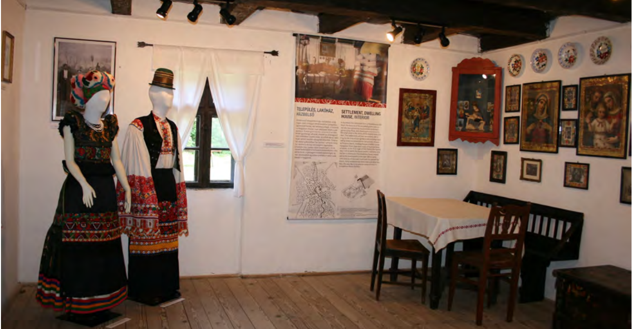
Részlet a kiállításból: mezőkövesdi fiatal pár ünnepi viseletben és hagyományos lakásbelső

Nyíregyháza, Sóstói Múzeumfalu (2021. június 23. – szeptember 26.)