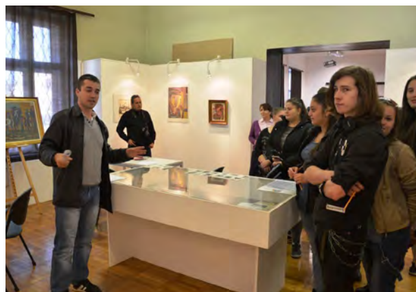
Diákok múzeumpedagógiai foglalkozáson az ózdi múzeumban a kiállításon (Ózdi Muzeális Gyűjtemény)

dett ki tanári és művészi pályája. A magyar történelem dicső és nehéz harcai érdekelték, hatással volt rá a magyar táj.