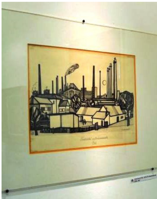
Tisztelet szülővárosomnak – Ózd című grafikája az Ózdi Muzeális Gyűjtemény és Gyártörténeti Emlékpark kiállításán, 2017-ben