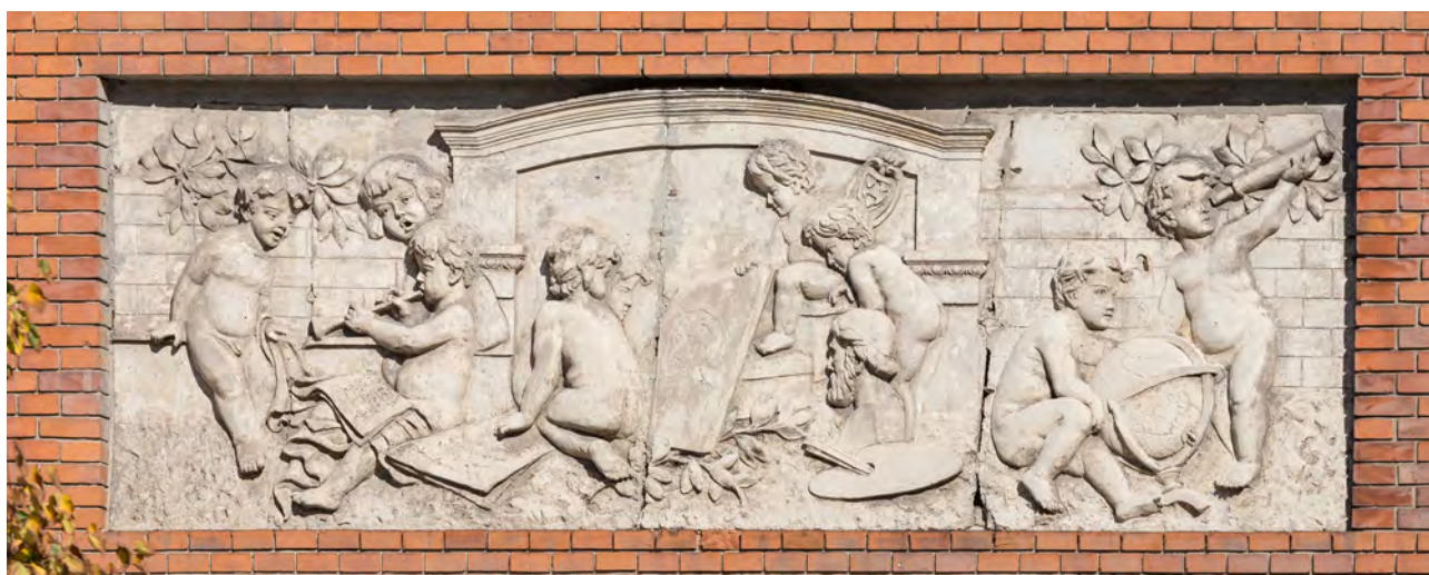
Földes Ferenc Gimnázium homlokzatának domborműve, 1913