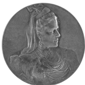
Országos Háziipari és Amatőr Kiállítás Miskolcon, ezüstözött bronzérem, 1912 (Herman Ottó Múzeum Numizmatikai gyűjtemény, ltsz: 97/552. Fotó: Mészáros Viktória)

25. Kőoroszlán = Magyar Jövő 1927. 138. sz. 4. o. (jún. 21.)