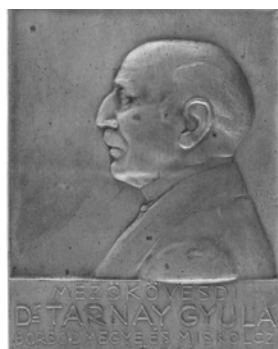
Dr. Tarnay Gyula Borsod megye és Miskolcz város főispánja plakett, aranyozott bronz, 1913 (Herman Ottó Múzeum Numizmatikai gyűjtemény, ltsz: 97/1277. Fotó: Mészáros Viktória)