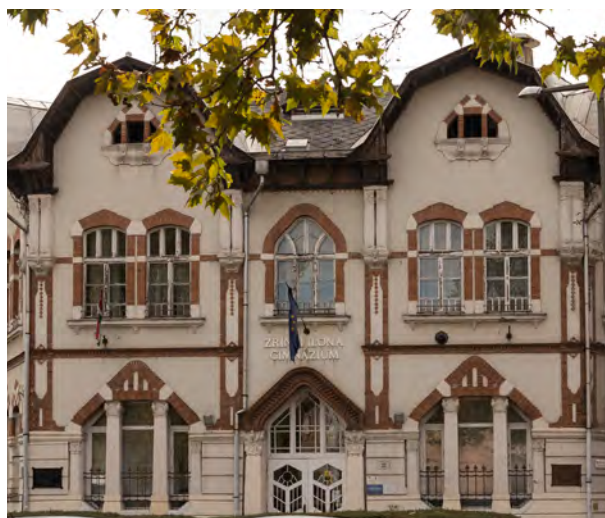
A Kis-Hunyad utcai Általános Iskola épületdíszei, 1909 A Rosenberg-ház épületdíszei (Széchenyi utca 22.), 1909 A Zrínyi Ilona Gimnázium épületdíszei, 1909