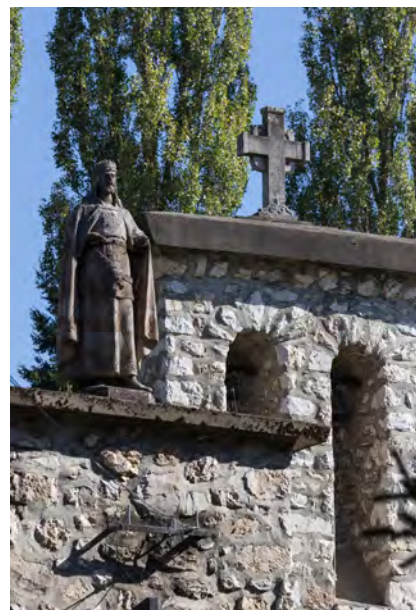
Kőkereszt a Sziklakápolna tetején, 1935

26. 10-es honvéd emléktábla a József-laktanya falában = 10-es Honvéd 1928. VIII. évf. 10. o. (máj. 6.); Reggeli Hírlap 1928. 103. sz. 2. o. (máj. 6.); Déli Hírlap 1992. 33. sz. 1. o. (febr. 8.); Észak-Magyarország 1993. 232. sz. (okt. 5.) Itt-Hon melléklet 5. o.; Dobrossy 2006. 1/1. 187.