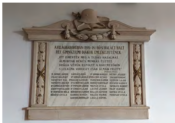
A Lévay József Református Gimnázium hősi halottainak emléktáblája, 1936 (Fotó: Szerző, 2022)

teményében [KÉP]; Papp János: A Szent Imre-szobor története. Kézirat a MVK Helyismereti Gyűjteményében; Mezőkövesdi Újság 1935. 45. sz. 1. o. (nov. 10.), ill. 2001. 10. sz. 5–6. o. (aug. 29.); Köztérkép adatbázis. Ld. még a 33. tételt.