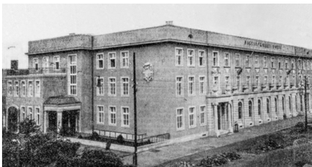
Címer a Postapalota oldalán, 1937 (Magyar Jövő 1937. 233. sz. 5.)