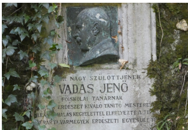
Vadas Jenő emléktáblája Felsőhámorban a sziklafalon, 1933