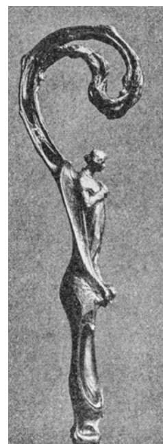
Luther Márton-portré a Luther-udvar bejárata fölött, készült 1897–1899 között (Fotó: Kiss Tanne István, 2021) Sárka, gipszszobor, 1904 (Herman Ottó Múzeum Képzőművészeti gyűjtemény, ltsz: 63.40. Fotó: Pirint Andrea) Főiskolás korában készített műve, a Pásztorbot, 1904 (Magyar Iparművészet 1904. 4. sz. 191. Repr: Mészáros Viktória)