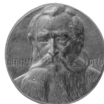
Herman Ottó emlékplakett, ólom, 1925 (Herman Ottó Múzeum Numizmatikai gyűjtemény, ltsz: 2013/113. Fotó: Mészáros Viktória)