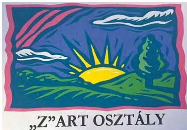
A festőtábor logója