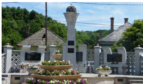
A millenniumi emlékmű Serényfalván

Később kicsit szétszakadt a csapat, a csoport már nem működik. Megöregedtünk, van, aki elköltözött, a barátságunk azonban megmaradt. Egyre kevesebbet alkotunk, de – ha lehet ilyet mondani – egyre jobbakat! A felgyülemlett tapasztalat meglátszik a műveken. Már megkeresnek a feladatokkal. Jelenleg 14 köztéri alkotásom látható, ebből Ózdon egy sem. Az első uniós emlékművet Bekölcén készítettem. Aztán Serényfalván a Millenniumi emlékművet, én erre vagyok a legbüszkébb. Farkaslyukban a 100 éves évfordulóra – ajándékba a településnek – készítettem egy emlékművet, és terveztem egy emlékparkot. Bódvarákón egytonnás cseppkőből készítettem oltárt, ami Európa-hírű lett. Jelenleg egy trianoni emlékművön dolgozom.