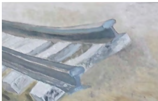
Vég nélküli sín