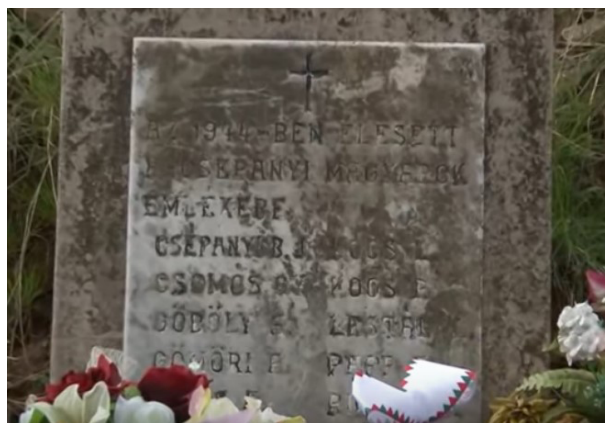
A csépanyi katonák síremléke Javorina temetőjében