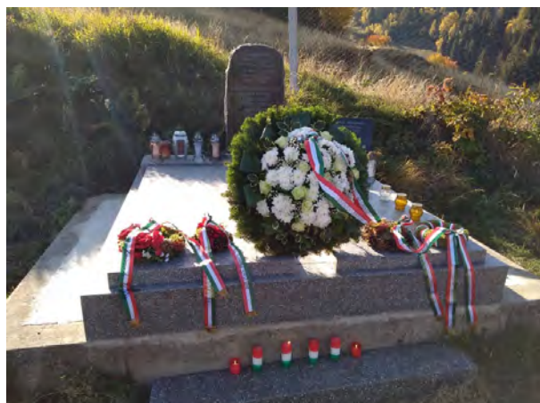
A csépanyi katonák felújított síremléke Klenóc-Pusztarét temetőjében