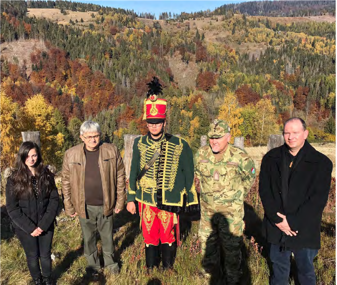
A síremlék felszentelésén résztvevők egy csoportja