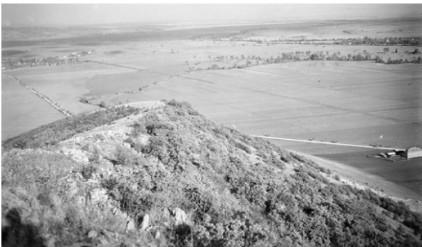
Az 1920-as trianoni döntés után a magyar–szlovák államhatár mentén felépült a határőrpület; mögötte, a hegy oldalában már látszik a kőfejtés