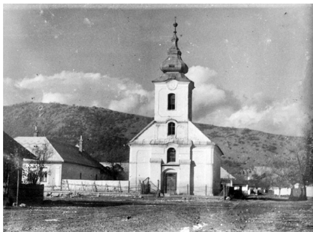
A falu közepéről nézve a háttérben már jól kivehető a bánya