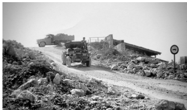
Az ötvenes években a csillét felváltotta a szállítószalag és a tehergépkocsi