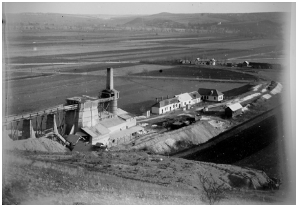
A telep és melléképületei, a háttérben a vasútállomással