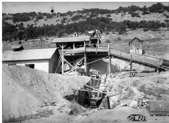
Bányatelep a gépesítés előtti időszakban

Egy 1951. március 15-én keltezett tájékoztató levélből – melyet a Szlovák Gipsz- és Mészgyár á.v. tornai leányvállalatának igazgatója, a mecenzéfi Böhmer írt a kassai központi igazgatóságnak – kiderül, hogy a kőbányát 1910-ben nyitották meg, és ekkor adták át rendeltetésének a régi kemencét is, amelyet olasz építők építettek. A bányaüzem a Tornai