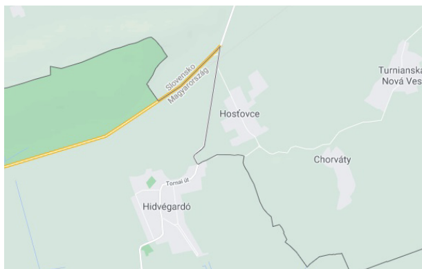
A Hidvégardó és Vendégi (Host'ovce) közötti háromszögű területet kérte volna a Csehszlovák állam

jelentős részét veszítette el. Ráadásul 1949-ben a magyar közlekedési minisztérium is hangsúlyozta, hogy mindenképpen területsere elérésére kell törekedni, minthogy az ötéves terv nagyarányú építkezései hatalmas mennyiségű kőanyagot fognak felémészteni, és szüksége van az országnak a bazaltra. A csehszlovák fél a Bazaltbánya Rt.-nek átengedendő bizonyos területért cserébe a Hidvégardó–Bódvavendégi kiszögellést kérte. Ez a háromszög alakú terület nemcsak mezőgazdaságilag volt értékes rész, hanem azért is, mert Bódvavendégi vasútvonallal, állomással és rakodórampával is rendelkezett, amely a magyar oldalon maradt. A magyar fél e kívánságot azonban nem teljesítette. 21