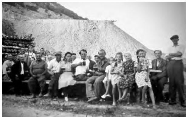
Majális a kavicshegy tövében