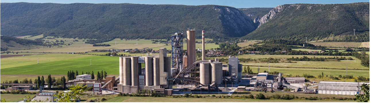
A csodás Szádelői-völgy előtt terpeszkedik a cementgyár

megáldott csodálatos Kassai-medence kellős közepébe telepítették a 350.000 m 2 kiterjedésű komplexumot, amely nem kis környezeti terhet ró a környékre és lakóira mind a mai napig. Nem beszélve a látványról: akár a levegőből, akár a magaslatokról gyönyörködnék a vidékben, a messzeségben, a tornai várban vagy a Szádelői-völgyben, igencsak zavaró a cementgyár látványa.