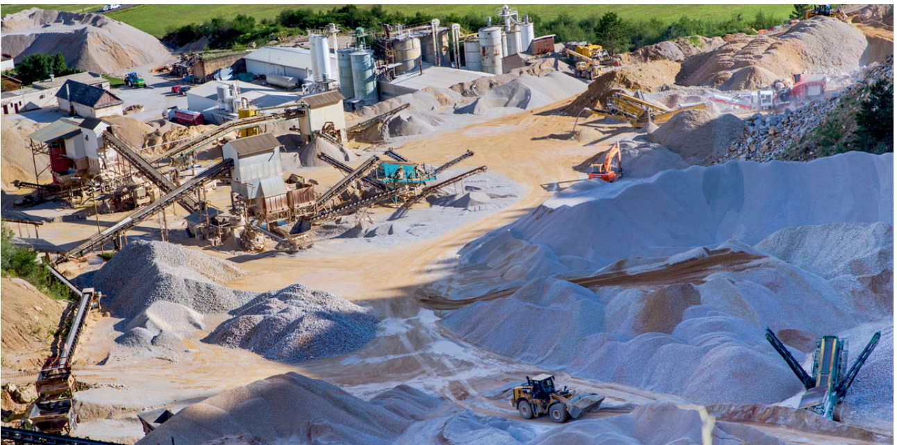
A bányatelep napjainkban (Forrás: Ametys)

https://hu.wikipedia.org/wiki/K%C3%BClfejt%C3%A9s