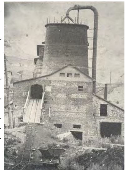
A két mészkemence a szénfelvonó hídval

Német építők megépítették a második, Danenberg-rendszerű aknás kemencét. 1928-ban felépült öt további melléképület a már meglévő háromhoz, melyeket még a Tornai Bank finanszírozott. Ettől az időtől fogva a vállalati melléképületek száma 1951-ig már nem változott. A Freimann fivérek központi irodája Kassán volt, a teleppel telefonos összeköttetésben álltak. 1930-ban üzembe helyezték az őrlőt, a műhelyt és a gázmotor épületét. Ez a motor hajtotta az elektromos áram bevezetéséig (1953) az őrlőt és az áramfejlesztőt. 15