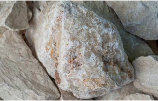
Világos galambszürke, tömött, fehér és vöröses felső triász korú mészkő