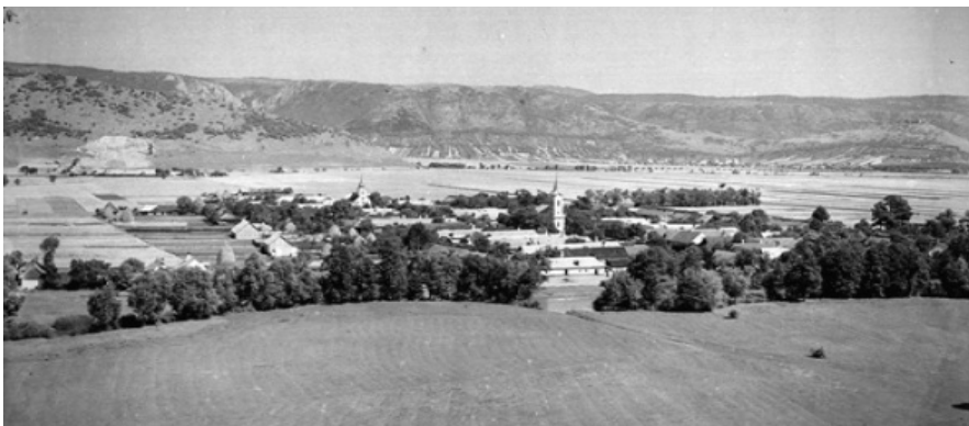
Bódvavendégi látkepe az 1940-es években, háttérben a bányával (Herman Ottó Múzeum gyűjteménye,)