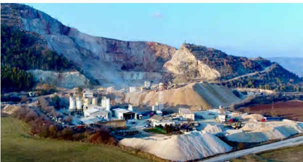
A bányatelep napjainkban