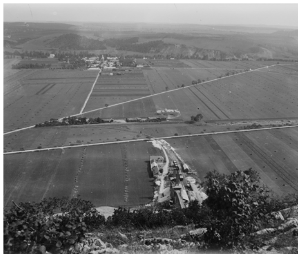
Jól látható, hogy a vasút elkanyarodik a bánya felé