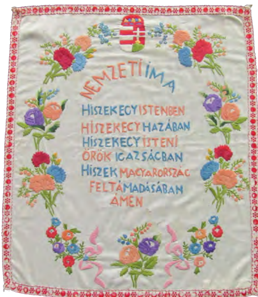
Himzett falvédő a Herman Ottó Múzeum gyűjteményéből

A téma érzékenysége miatt még napjainkban sem sokan mernek vagy nem szeretnek beszélni Trianonról, de bízom abban, hogy ez a tudományos konferencia segített jobban megérteni az okokat, feldolgozni ennek következményeit. Megérteni azt, hogy mi okozhatta a Kárpát-medencében korábban több évszázadon keresztül jól működő államszervezet felbomlását, mi vezethetett a korábban békésen egymás mellett élő népek ellenérzéseinek felerősödéséhez. Múltunk megértése, feldolgozása azért is fontos, hogy többé ne fordulhasson elő nemzetünk történetében ehhez hasonló történelmi tragédia. Bízom benne, hogy e konferencia hozzájárulhatott ahhoz is, hogy faluközösségünk régi és új tagjai jobban megismerhessék egymást, és bízom abban is, hogy segített tovább mélyíteni a kapcsolatokat a határ mindkét oldalán élő magyarság között is. Azzal, hogy meg tudunk emlékezni a tragikus történelmi eseményről 101 évvel később, azt bizonyítja, hogy képesek vagyunk e tragédia után is a nemzeti megújulásra és az előttünk álló történelmi feladatok megoldására. Ahhoz, hogy e méltó megemlékezés az utókor számára is megmaradjon, tervezzük a konferencián elhangzott előadások anyagának megjelentetését könyv formájában.