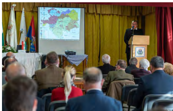
A Trianon-konferencia megnyitója.

vott előadók közül a határon túlról, a Felvidékről is érkeztek előadók, akik saját szemszögükből mutatták be a történelmi eseményeket. A Hidvégardóban 2021. november 13–14-én megrendezett kétnapos Országos Tudományos Trianon-konferencia egyedülálló esemény volt nemcsak megyénkben, hanem az egész észak-magyarországi régióban is, hiszen a magyarországi nagyobb egyetemek, tudományos műhelyek által rendezett hasonló témájú konferenciákon sem gyűlt össze annyi előadó, mint községünkben. A konferenciára közel 30 előadót hívtunk, közülük mindössze ketten nem tudtak eljönni, tehát óriási volt a részvételi arány az előadók részéről. E konferencia abból a szempontból is kitűnt az ország többi részén megrendezett konferenciák közül, hogy nem kizárólag egy szempontból, hanem a tudományterületek legszélesebb aspektusából mutatta be e történelmi tragédiát.